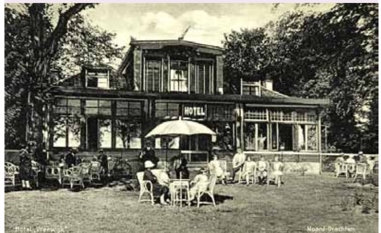
Hieronder: Vreewijk als hotel in 1932

omringd door een wandelbos met veel opgaand hout en een tuin met vruchtbomen, hokken en dergelijke.'