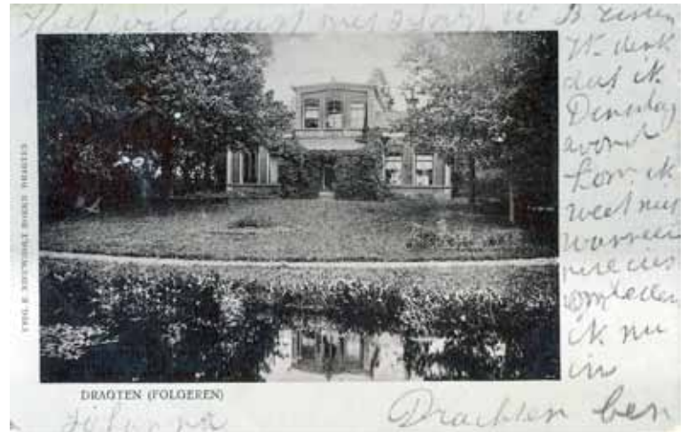
Boven: Vreewijk nog als woning in gebruik, omstreeks 1905